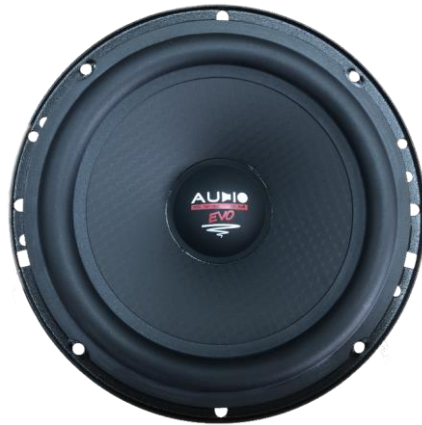
EX 165 SQ EVO3