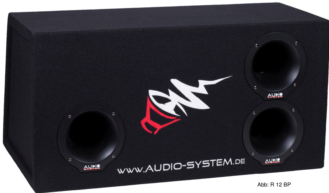
Abb: R 12 BP