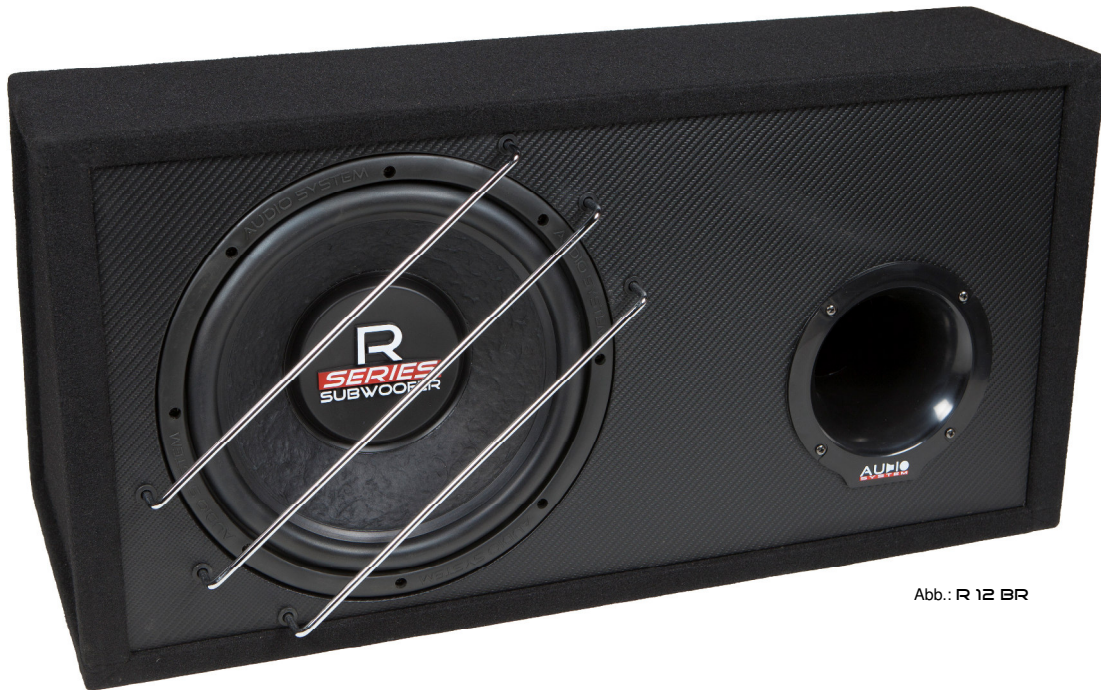
Abb.: R 12 BR