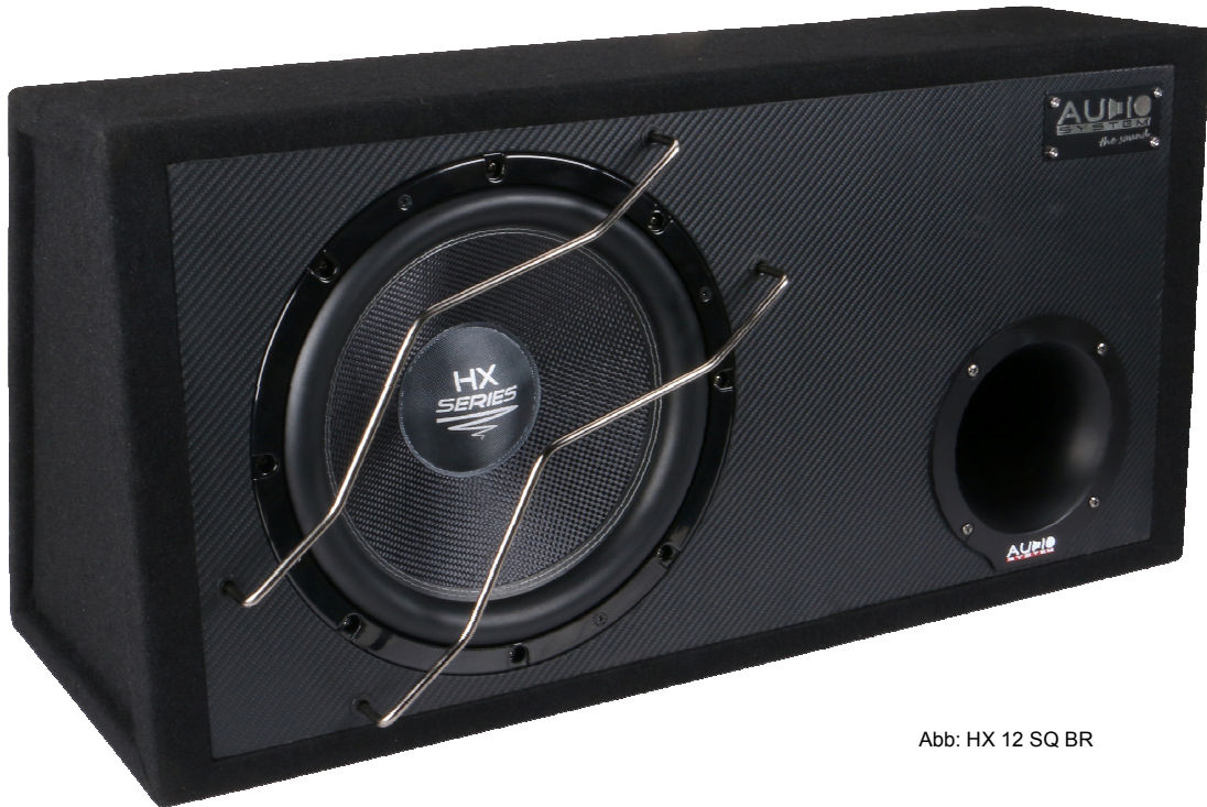
Abb: HX 12 SQ BR