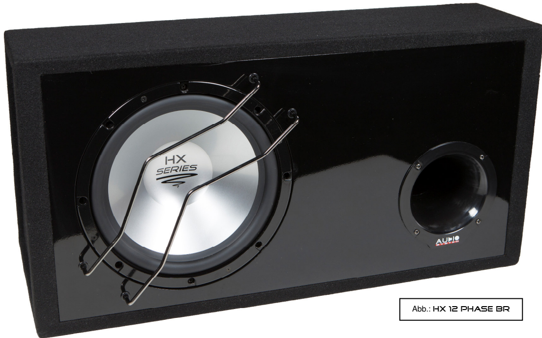
Abb.: HX 12 PHASE BR