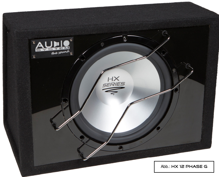
Abb.: HX 12 PHASE G