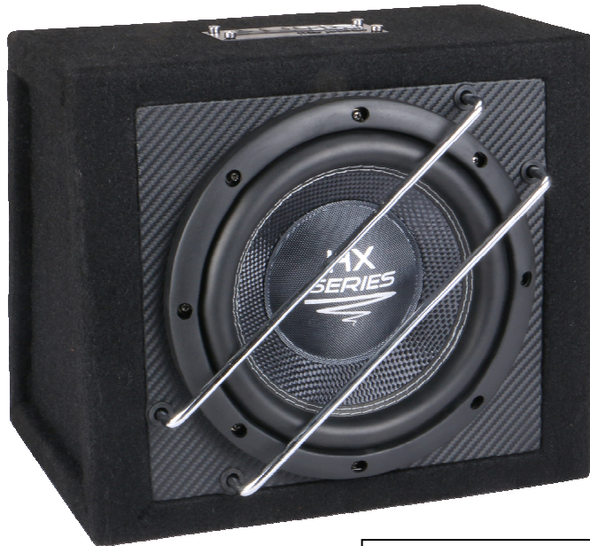
Abb.: HX 08 SQ G