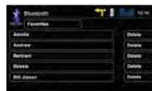
Menu composizione veloce

Potrete ricercare un contatto in rubrica o sulla lista dei preferiti. Ma potrete anche visualizzare la lista chiamate ricevute/effettuate o perse.