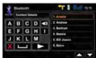
Ricerca contatti veloce

Potrete connettere fino a 5 telefoni cellulari all'E>GO, ognuno con 1,000 contatti. La rubrica del vostro cellulare si sincronizzerà automaticamente all'E>GO.