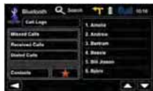
Pratica gestione dei contatti

La funzione di ricerca alfabetica rende la ricerca di un contatto più facile: digitate semplicemente le lettere iniziali. Potete ricercare utilizzando fino a 15 lettere iniziali.