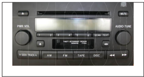
PRADO L. CRUISER