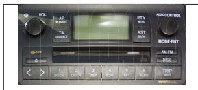
PANASONIC W 58814