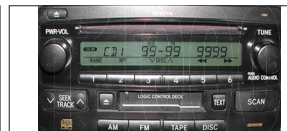
CAMRY 1 12821-13803