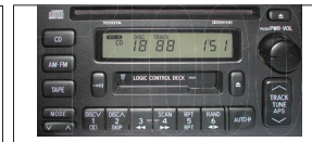
PANASONIC W 58810