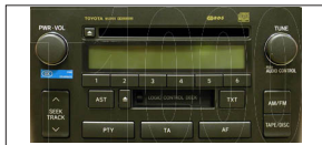
PANASONIC W 53901-03-04